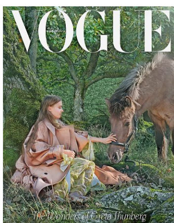
Greta Thunberg in der ersten Ausgabe der «Vogue Scandinavia» (August 2021).

Zudem gehört gerade eine milde Kontroverse zu einem beliebten Aspekt, um das Titelrennen zu entscheiden. So liess sich