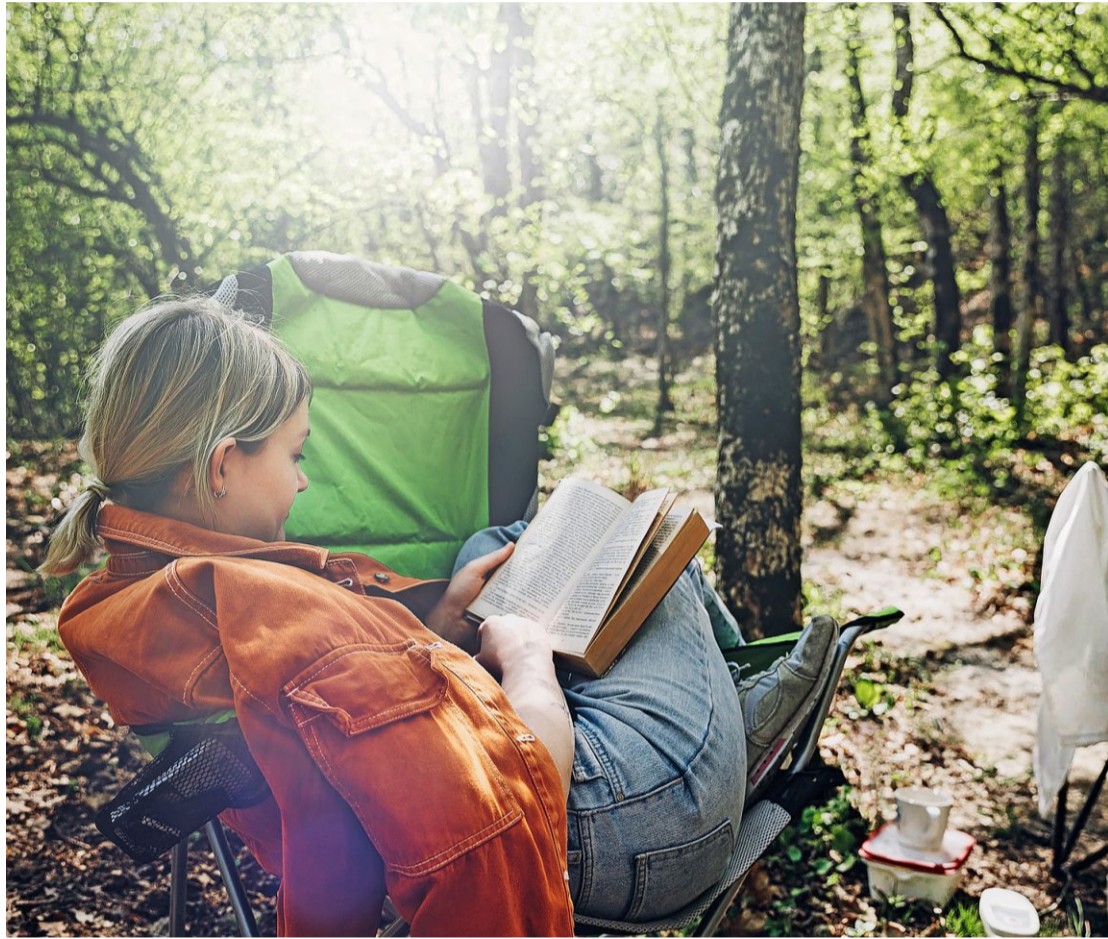
Zeit und ein gutes Buch – so einfach kann Glück sein.