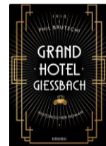
Phil Brutschi: «Grandhotel Giessbach», Emons-Verlag, 2021, 464 S., ca. 21 Fr.

aus der Belle Époque offensichtlich genau recherchiert und durfte sogar das Archiv des Grandhotels Giessbach benutzen. Zudem erzählt er seine teilweise an wahre Ereignisse angelehnte Geschichte temporeich und spannend.